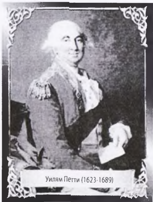
Уилям Петти (1623-1689)

Пайдоиши равияи илмии иқтисоди сиёсии класикӣ ба давраи пайдоиши тарзи сармоядорӣ истеҳсолоти ҷамъиятӣ рост омад. Аз асри XVI дар Инглистон тарзи феодалии истеҳсолот рӯ ба таназзул ниҳода, дар дохили он муносибатҳои истеҳсолии сармоядорӣ арзи вучуд кард, ки баъдтар дар асрҳои XVII ва XVIII бо суръати тез тараққӣ карданд. Дар натиҷаи ҷараёни мусодираи ғоратгарона дех-